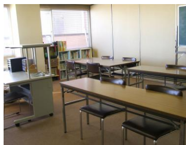
【ふれあい教室の様子】