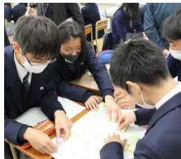
授業(グループワーク)