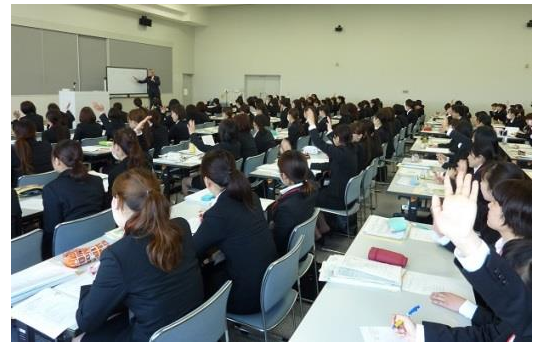
野村所長による講話のひとコマ

この研修をはじめ、センターでは9種類の研修講座を開設します。 幼児教育センターでの研修を、保育の質の向上にお役立て下さい。