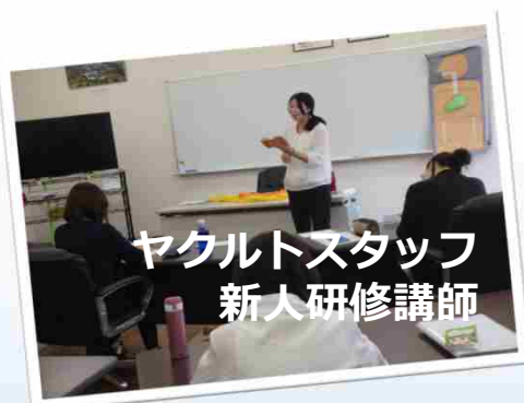
ヤクルトスタッフ 新人研修講師