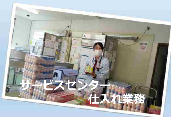
サービスセンター 仕入れ業務