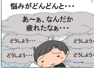
〈中学校版のスライド〉