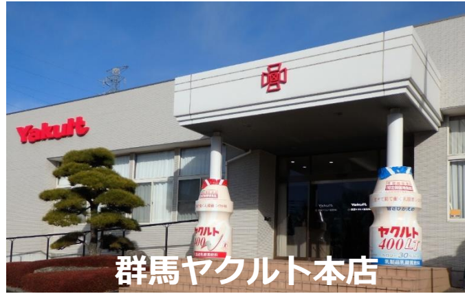
群馬ヤクルト本店