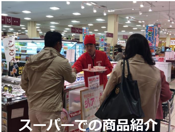
スーパーでの商品紹介