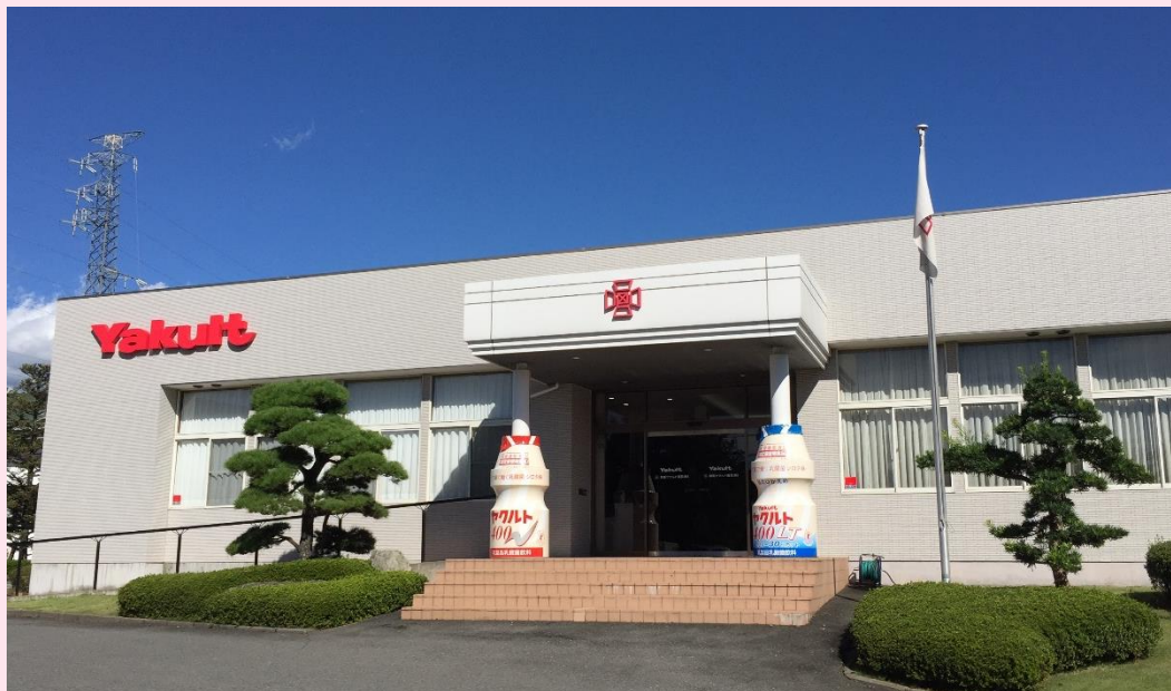
群馬ヤクルト販売株式会社本社