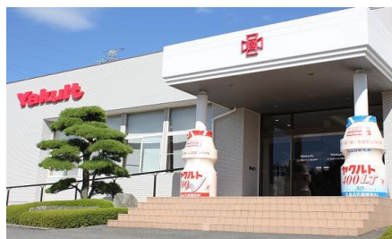
群馬ヤクルト販売株式会社