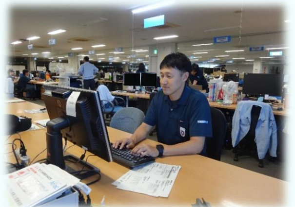
部品データ整理(開発本部)