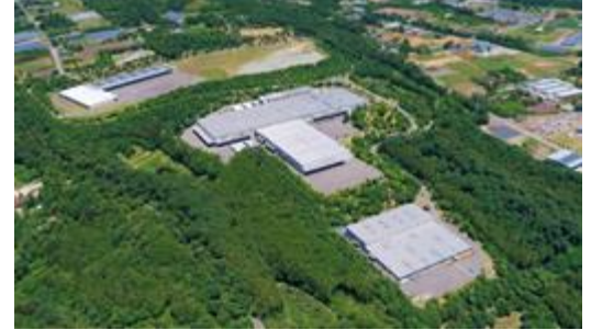
工場周辺の豊かな自然環境