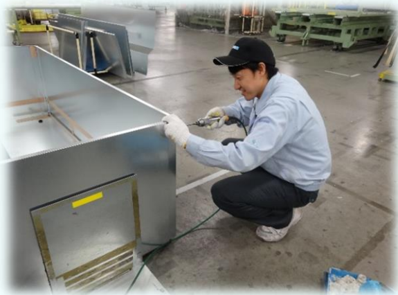
ショーケースの製造(生産本部)