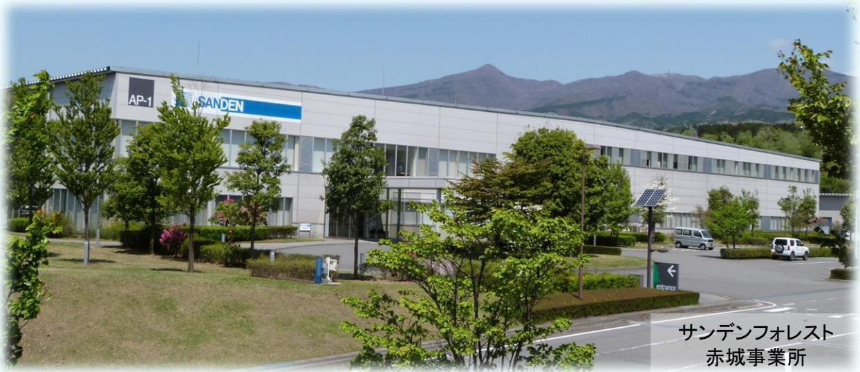
サンデンフォレスト 赤城事業所