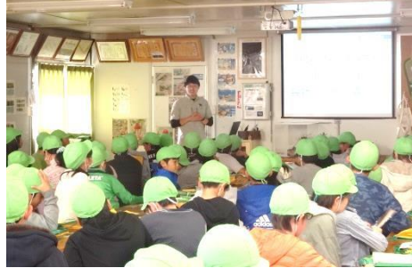
工場見学・環境学習