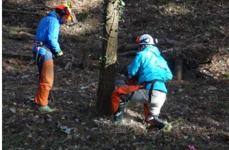
危険のある木を切る仕事

会社は、工場の中だけではなく、広い土地全体の見回りをしたり、危険な枝や木を切ったりするなど、働く人も利用する人も安全にすごせる活動をしています。こうした活動でできた自然環境を活用し、多くの人が工場見学や環境学習を行えるようにしています。