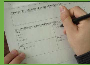
①習得した知識の振り返りと整理