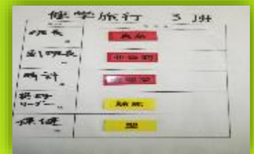
話し合いで活用したホワイトボード