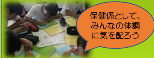
鎌倉散策後の「ステップアップカード」