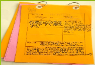
団活動の「ステップアップカード」綴り