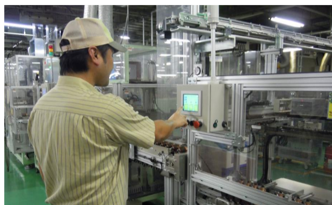
四輪スターターモーターの製造