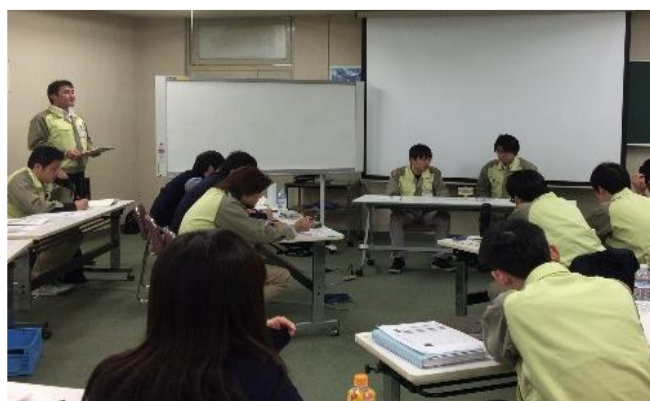
階層別研修【業務の教え方】