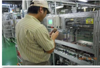
■ マシンオペレーター (技能職)

高等学校からは、主に「技能職」「技術職」「事務職」といった職種に就職することができます。