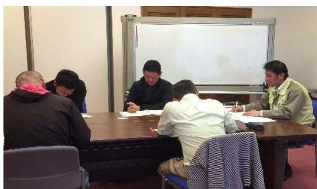
管理者マネジメント研修