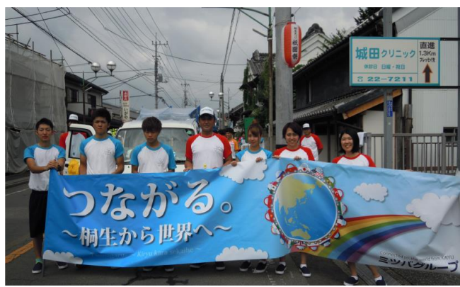
地域貢献活動【桐生祭りジャンボパレード】