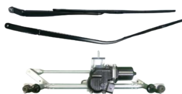
【フロントワイパーシステム】