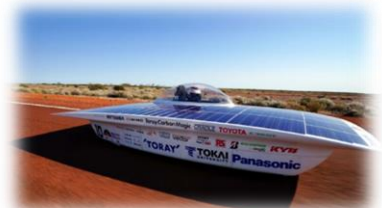
【ソーラーカーレース】