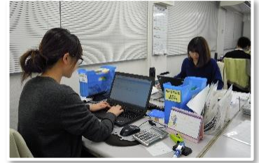
■ 伝票整理、電話対応 (事務職)