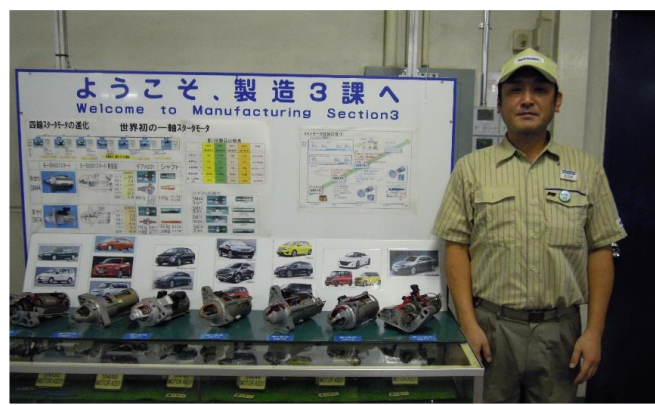
新里工場製造3課での研修