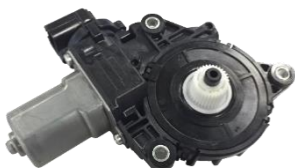
【パワーウィンドウモーター】