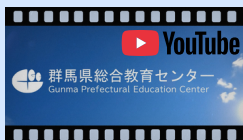
総合教育センター紹介動画