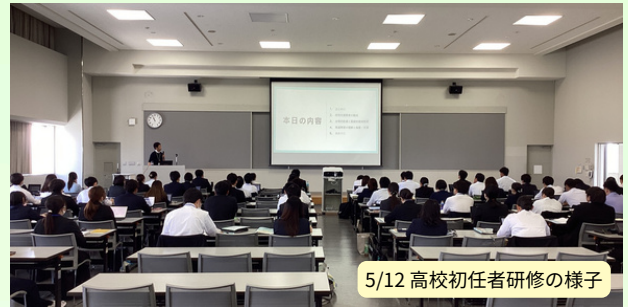
5/12 高校初任者研修の様子