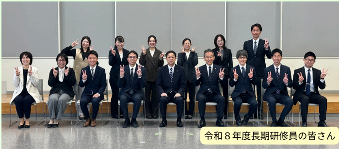
令和8年度長期研修員の皆さん

今年度も、皆様に役立つ情報を厳選してお届けしてまいります。 どうぞご期待ください!