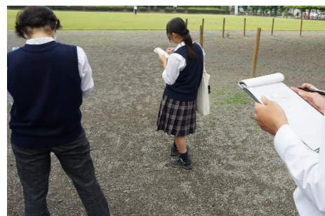
図2 現地調査の様子

実際の学校庭園を対象地とし、植生・地形・土壌・生物・気象といった自然環境や、利用状況・周辺施設・維持管理といった社会環境について調査を実施した。現地調査活動では、対象地にて観察や測量を実施するだけでなく、文献調査によって庭園が設置された背景などを踏まえた。また、事前に設置者である学校長へのヒアリングを実施し、計画に当たってはより実現性を高めることを考慮した。