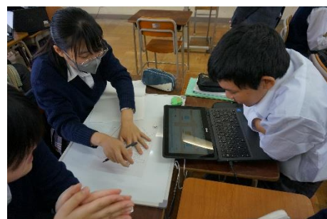
図3 分析を行う様子

始めに個人で作成した事前調査ワークシートを用いて、デジタルホワイトボード上で要素ごとに考えを整理した。その後、個人でSWOT分析を実施し、現況に対する自らの考えをまとめた。個人での分析を踏まえた上で、グループでのSWOT分析とクロスSWOT分析を行った（図3）。クロスSWOT分析の実施に当たり、グループごとに分析する組合せを、対象地の特色を踏まえて二つ選択した。