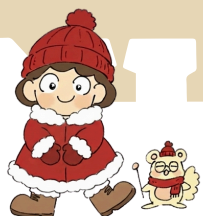
かりん きゅらむ せんた