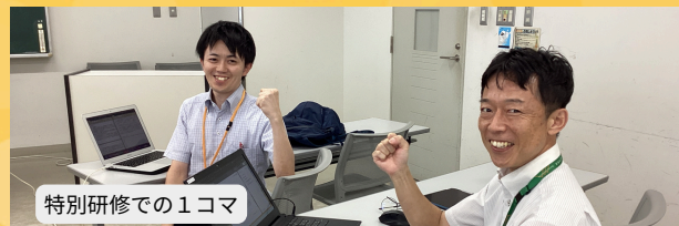
特別研修での1コマ