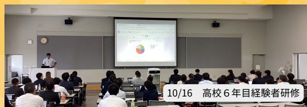
10/16 高校6年目経験者研修