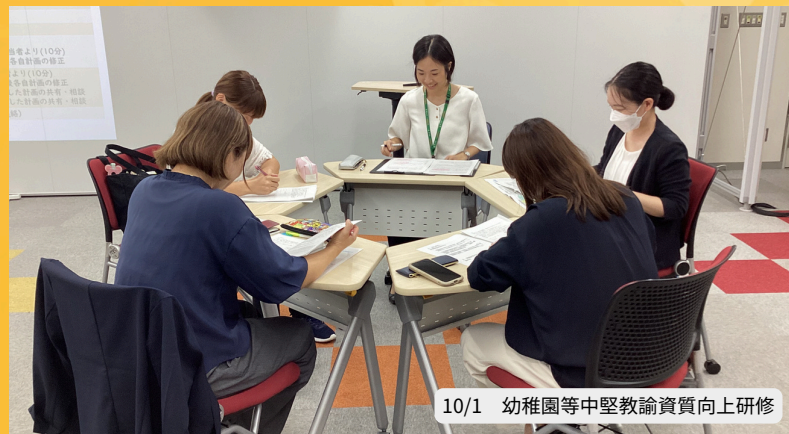
10/1 幼稚園等中堅教諭資質向上研修