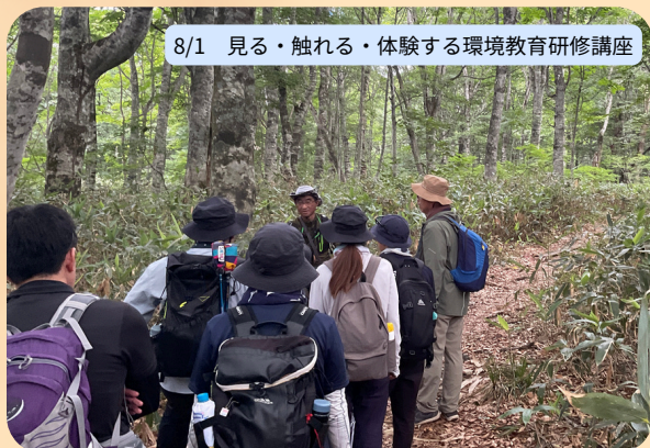
8/1 見る・触れる・体験する環境教育研修講座