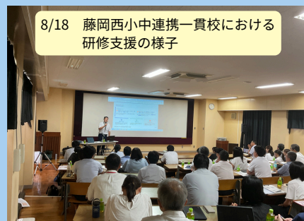
8/18 藤岡西小中連携一貫校における 研修支援の様子

本センターでは生成AIに関する研修支援も行っておりますので、ぜひご活用ください。