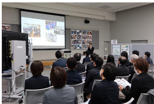
【研究成果発表：義務教育研究係】

総合教育センターにおける教育研修員の研究成果発表を軸に外部講師による特別講演など、教育における最新の情報を提供し、群馬の教育の在り方について考える機会とします。参加して良かったと思える新しいスタイルを目指して、2月7日（土）に開催する予定です。