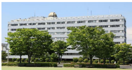
群馬県総合教育センター(伊勢崎市今泉町)