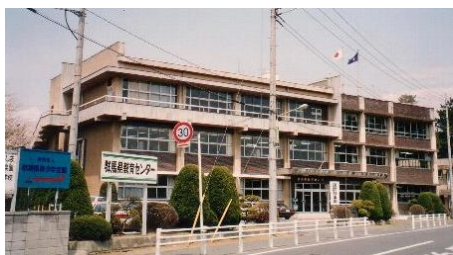
群馬県教育センター(前橋市荒牧町)