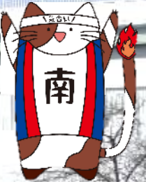
玉村町立南中学校 キャラクター 「みなニャンコ」