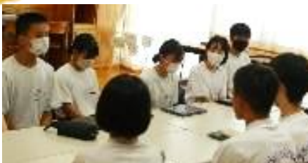
高校や他の中学校へのインタビュー