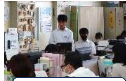
職員会議の場で、 生徒会本部から提案