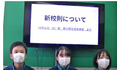
生徒による校則改定に ついての全校放送