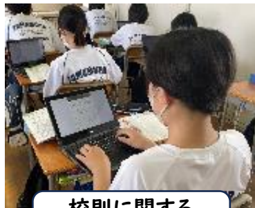
校則に関する アンケートの実施

高校の先生に聞きました! ・ツーブロックは、高校でも 意見が多く出ていて、 検討中です。