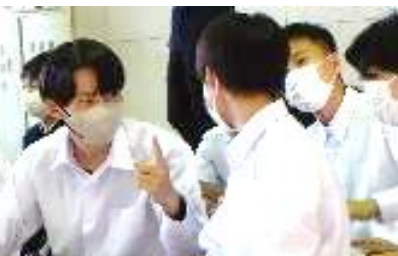
生徒同士の会話から 学校課題を捉える