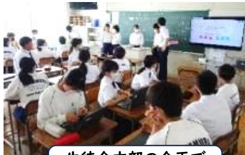
生徒会本部の企画で 学級委員会と話し合い

高校の先生に聞きました! ・ツーブロックは、高校でも 意見が多く出ていて、 検討中です。