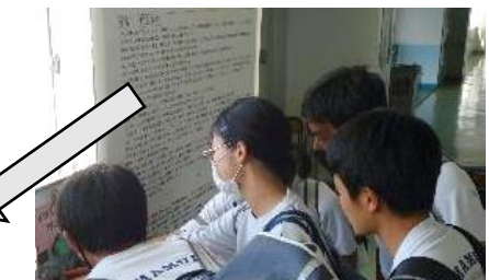
インタビュー内容の掲示・共有