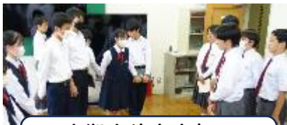
次期生徒会本部へ 活動の引継ぎ