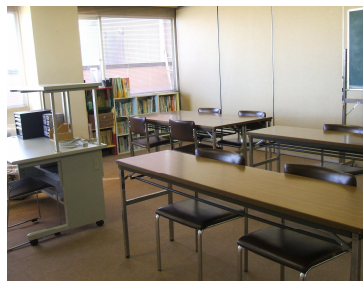
【ふれあい教室の様子】